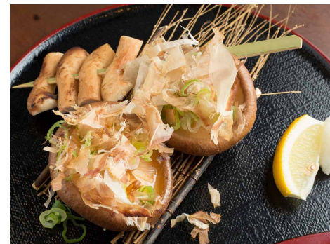
Charcoal-grilled Yairo Shiitake Mushrooms 八色しいたけ炭火焼 ¥500