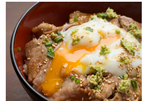
Rice Bowl with Mochibuta Pork and Fresh Wasabi 和豚もちぶた生わさび丼 ¥1,200