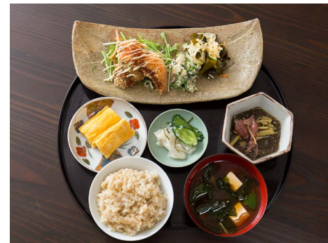
Weekdays only! Evening 1500 yen Set Meal