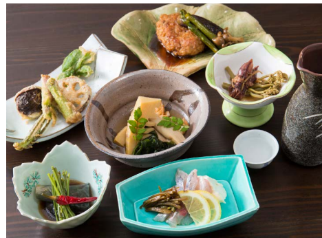
2800 yen Tasting Menu that goes well with sake