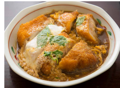
Simmered Pork Cutlet カツ煮 ¥750