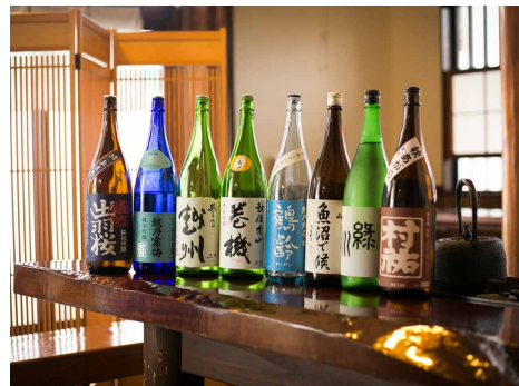
Japanese Sakes, Junmai Sakes from this prefecture and others 日本酒・県内県外純米酒 ¥650～