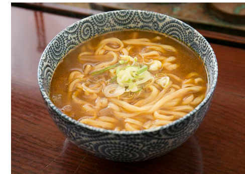
Curry Udon カレーうどん ¥700

やきとり盛合せ Yakitori Selection Meat 肉やさい炒め Vegetable Stir