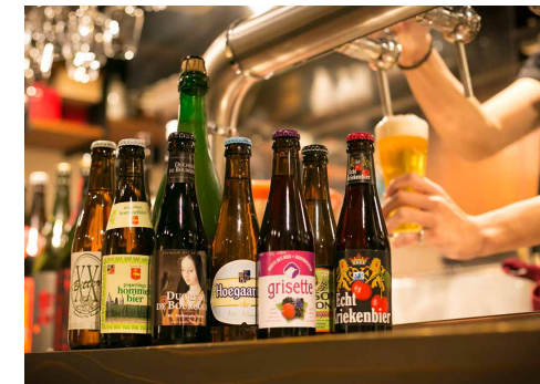
Belgian Beers ベルギービール各種 ¥750～