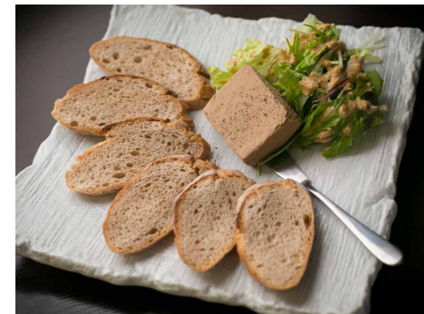
Home-made Liver Pate 自家製レバーのパテ ¥700